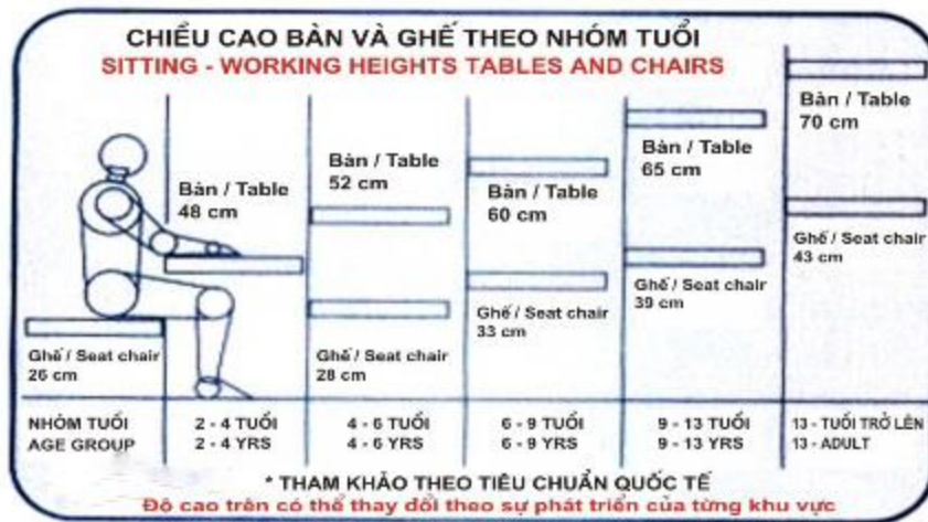
Bảng kích thước chiều cao bàn, ghế phù hợp với từng độ tuổi của bé

Chiều cao của bé khi ngồi: bố mẹ nên lựa chọn bàn hoặc điều chỉnh độ cao của bàn phù hợp với chiều cao của bé. Khi ngồi, phần ngực của bé ngang với mặt bàn là hợp lý, khuỷu tay vuông góc với mặt bàn.